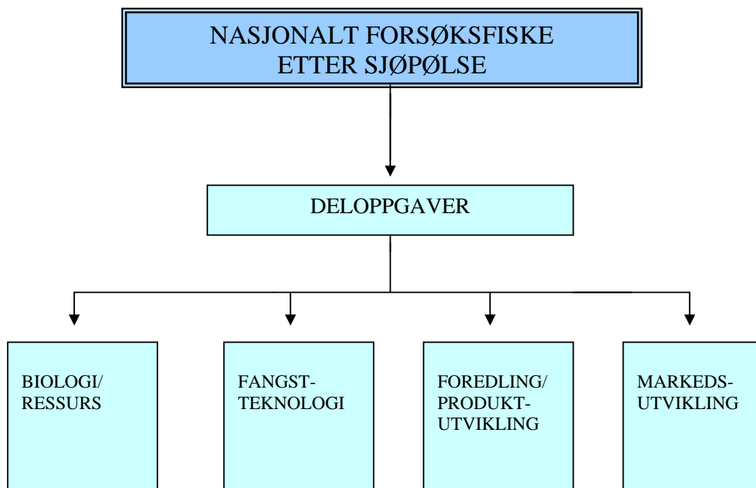
Figur 1. Oversikt over prioriterte oppgaver i handlingsplanen.

Gjennomføring av forsøksfiske, bearbeiding, foredling og omsetning av rødpølse er hovedoppgavene i handlingsplanen. Forsøksfisket og utvikling av ressurs- og miljøvennlig redskap vil være fundamentet for de øvrige aktivitetene i planen. Utviklingsoppgaver innenfor fiske, fangstbehandling, produkt- og råstoffegenskaper, foredling og markedsutvikling bør gjennomføres parallelt for at næringen skal kunne utvikle en lønnsom utnyttelse av rødpølse. For å få mer kunnskap om ressursgrunnet er det i tillegg viktig å gjennomføre biologiske undersøkelser for arten. Figuren nedenfor viser hvilke oppgaver en vil prioritere i fireårs perioden.